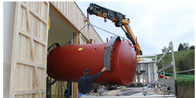
Einbringen eines WRG-Speichers in eine Käserei

In Industrie und Gewerbe steht recht häufig wirtschaftlich nutzbare Abwärme zur Verfügung. Geeignete Projekte könnten durch uns finanziert werden.