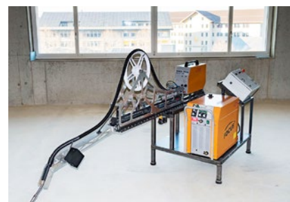
← Wärmetauscher aus CrNi Stahl ↑↑ Podiumsgespräch im Forum Jenni ↑ Innenschweissmaschine → Spatenstich Solar-MFH Huttwil