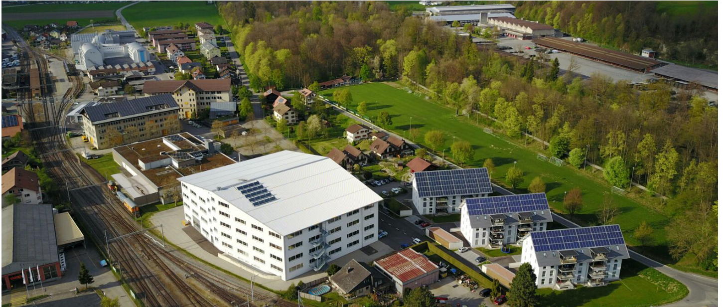
Solarpark Burgdorf mit Grossspeicherbau, Hauptgebäude, Kleinspeicherbau, Solareinfamilienhaus und den drei Mehrfamilienhäusern