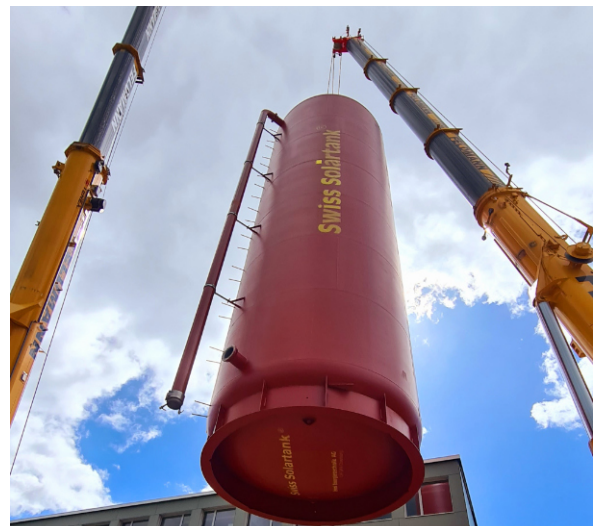
Einbringung des Speichers in Fehraltorf (ZH)