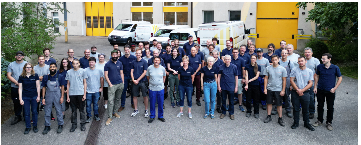
Ein Teil des engagierten Jenni-Teams am 26. August 2024