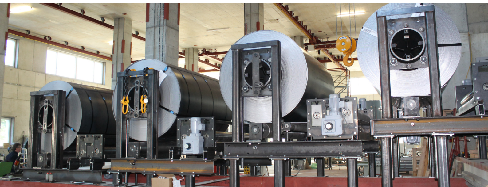
Fest installierte Maschinen für wirtschaftlichere Abläufe in der Grossspeicherproduktion; im Bild: Abcoilanlage