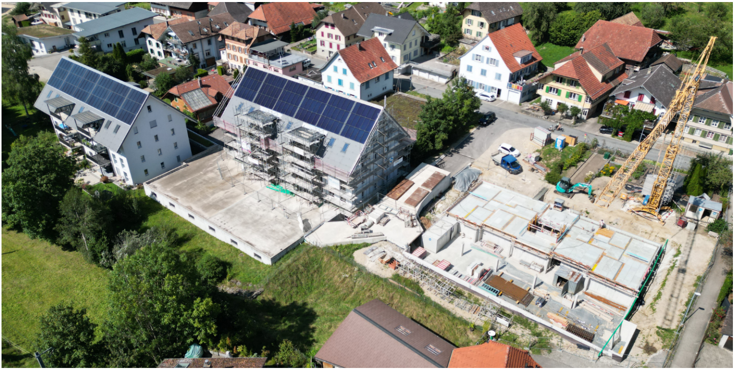
Baufortschritt Haus 2 und 3 in Huttwil