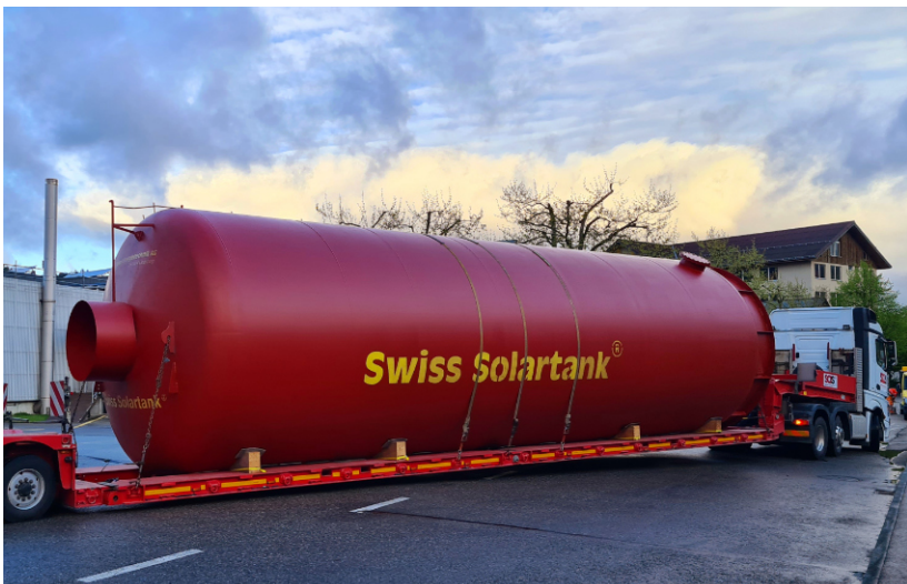
Ein weiterer Grossspeicher verlässt das Werk Richtung Fehraltorf (ZH)