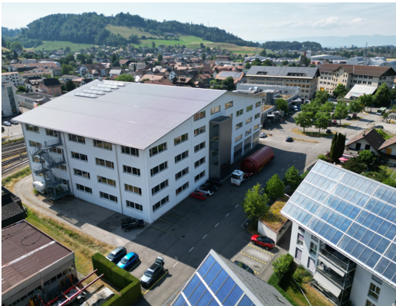
Produktions- und Wohnbauten: Solarpark Burgdorf