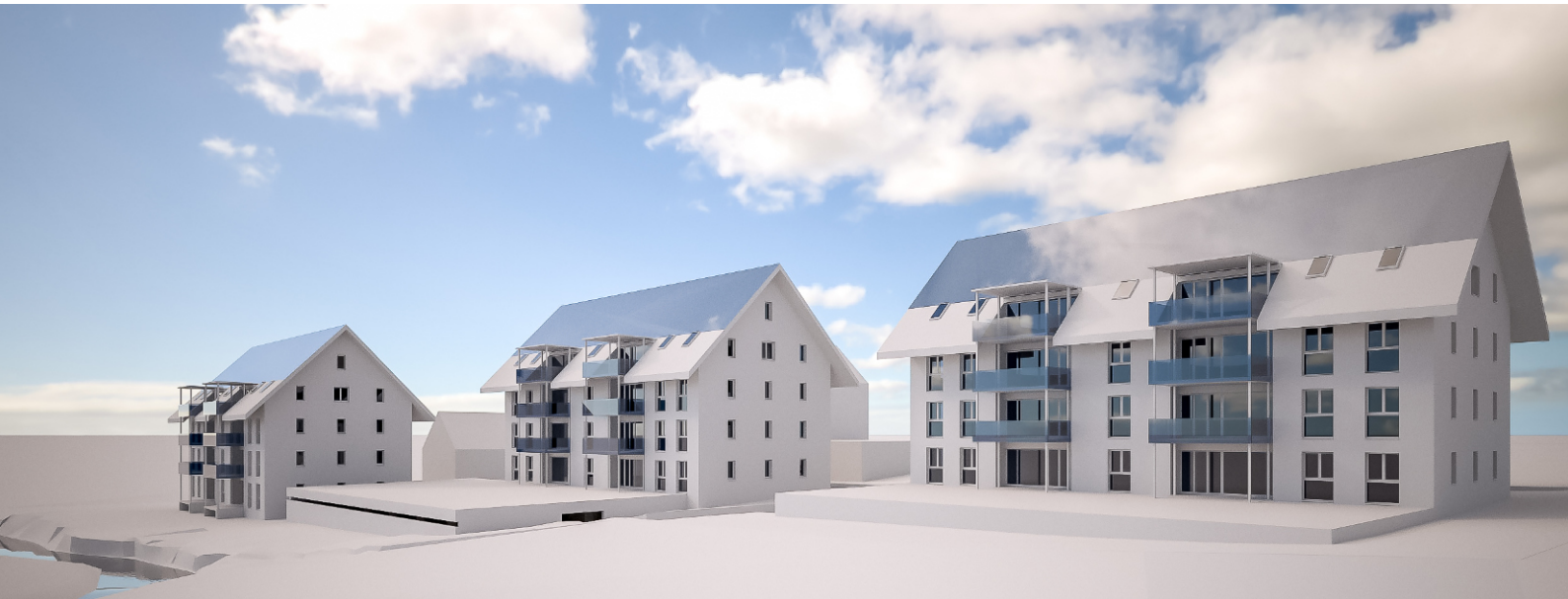
Plan und Endausbau der drei 100 % solarbeheizten Mehrfamilienhäuser in Huttwil.