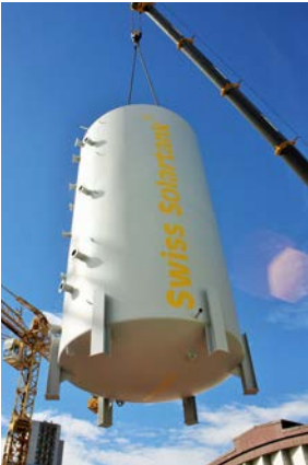
66 000 Liter Kältespeicher, Umweltarena Spreitenbach