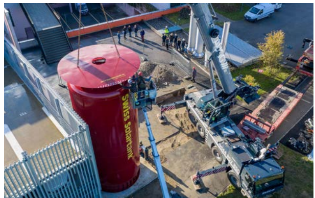
100 000 Liter, Hackschnitzel + Gas, Wärmeverbund Burgdorf Süd