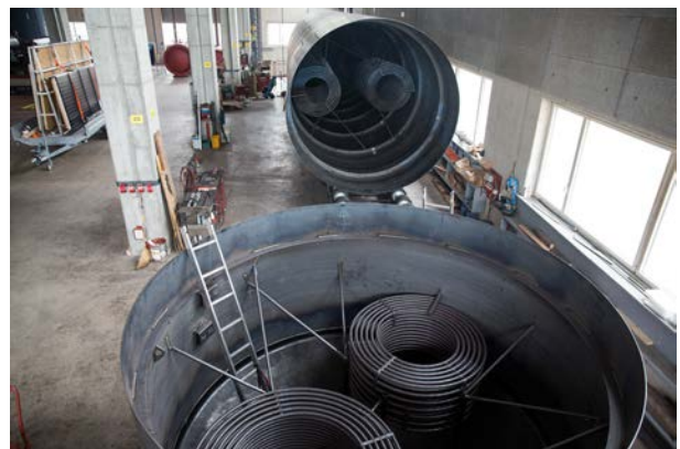
200 000 Liter, Solarthermie, Chemnitz DE