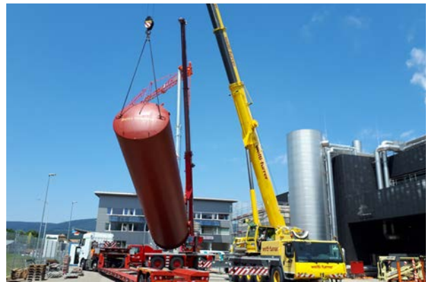
2x 120 000 Liter, Abwärmenutzung, Ricola, Laufen