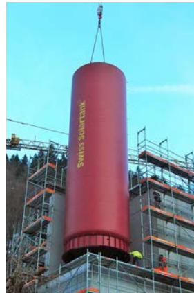
200 000 Liter, Holzschnitzel, Heizwerk Engelberg