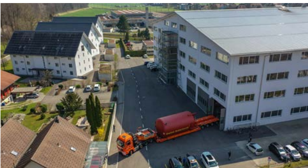
100 000 Liter, Holzschnitzel, Wärmeverbund Sarnen