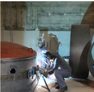
6 x 8000 Liter, platzgeschweisst, Abwärmenutzung, Bern