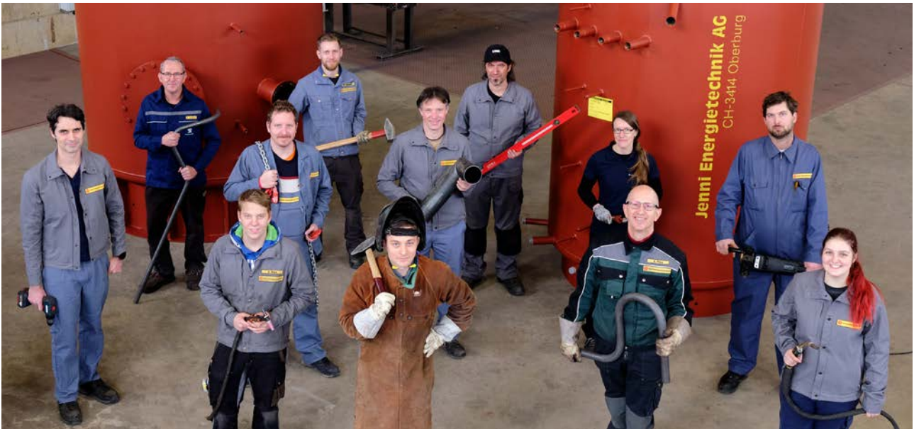
Unser eingespieltes Team im Grossspeicherbau ist stolz auf die Energiespeicher, die unsere Werkstatt verlassen.