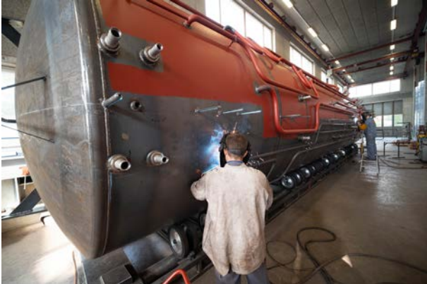
89 000 Liter, Solarthermie + Holz, Wohnüberbauung Mettmenstetten

Seit 40 Jahren produzieren wir Energiespeicher für zahlreiche Anwendungsfelder und setzen dabei Massstäbe in Langlebigkeit und Schichtungseffizienz! Wir bieten Ihnen kurze Lieferfristen dank effizienter Produktion und grosser Lagerhaltung der Ausgangsmaterialien.