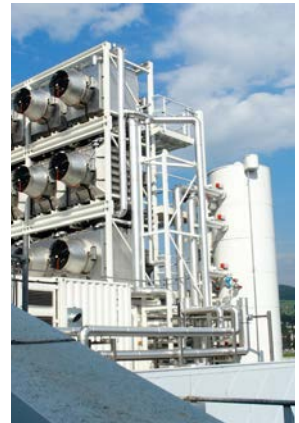
10 500 Liter, CO2 Capture, Climeworks, Hinwil