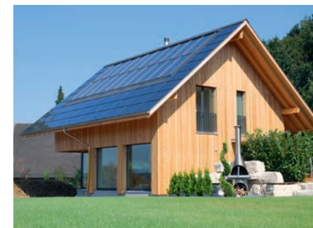
Sonnenhaus in Seeberg

Wenn mit dem ersten Quadrat der Energiebedarf eines nach Vorschrift gedämmten Hauses dargestellt wird, kann mit einer kräftigen Solarwärmanlage ein Drittel bis die Hälfte des Wärmebedarfs unmittelbar erzeugt werden. Mit einer guten passiven Sonnenenergienutzung (gute, nach Süden orientierte Fenster) kann ein Viertel bis ein Drittel des Energiebedarfs eingespart werden. Durch deutlich verbesserte Dämmung und allfälliger Einsatz einer Lüftungsanlage mit einer guten Wärmerückgewinnung reduziert sich der Bedarf weiter so, dass der geringe Restenergiebedarf spielend mit einem Kaminofen im Wohnbereich sehr effizient ergänzt werden kann (siehe Beispiel effiziente Holzenergienutzung Seiten 61–63). Der Holzbedarf im Einfamilienhaus kann im Bereich von 200 bis 300 Kilogramm pro Jahr liegen.