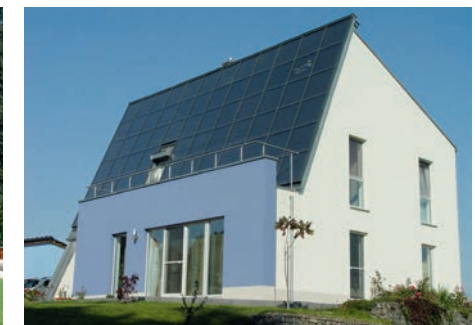
Energetikhaus 100 – Fasa AG, Chemnitz