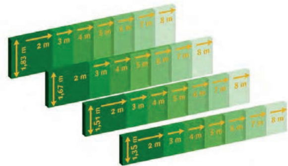
PV und Kombination PV/Solarthermie

Jenni Energietechnik AG beliefert mit ihren Komponenten den lokalen Installateur. Wahlweise werden die Kollektoren per LKW auf die Baustelle oder mit dem LKW-Kran direkt aufs Dach geliefert. Preise für Lieferung aufs Dach und allfällige Mithilfe bei der Installation/Montage der Kollektoren auf Anfrage.